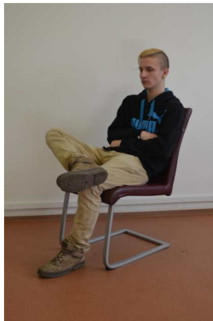
Nekomunikativní bariéry z rukou i nohou