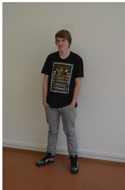
Nekomunikativnost, drzost, odpor, neúcta