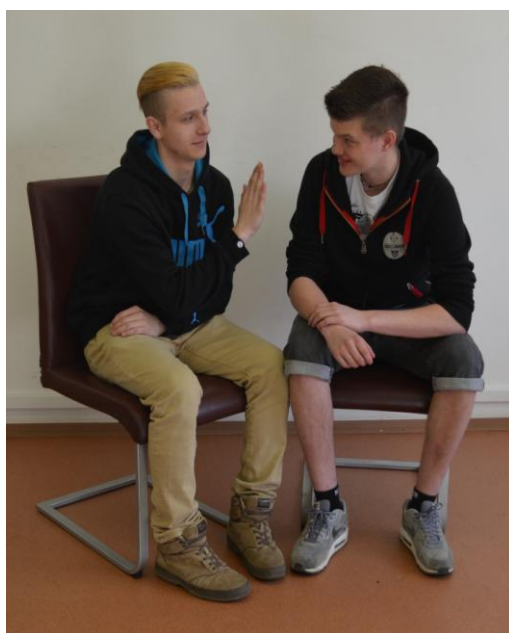
Vymezuje si svůj prostor (komunikační i fyzický)